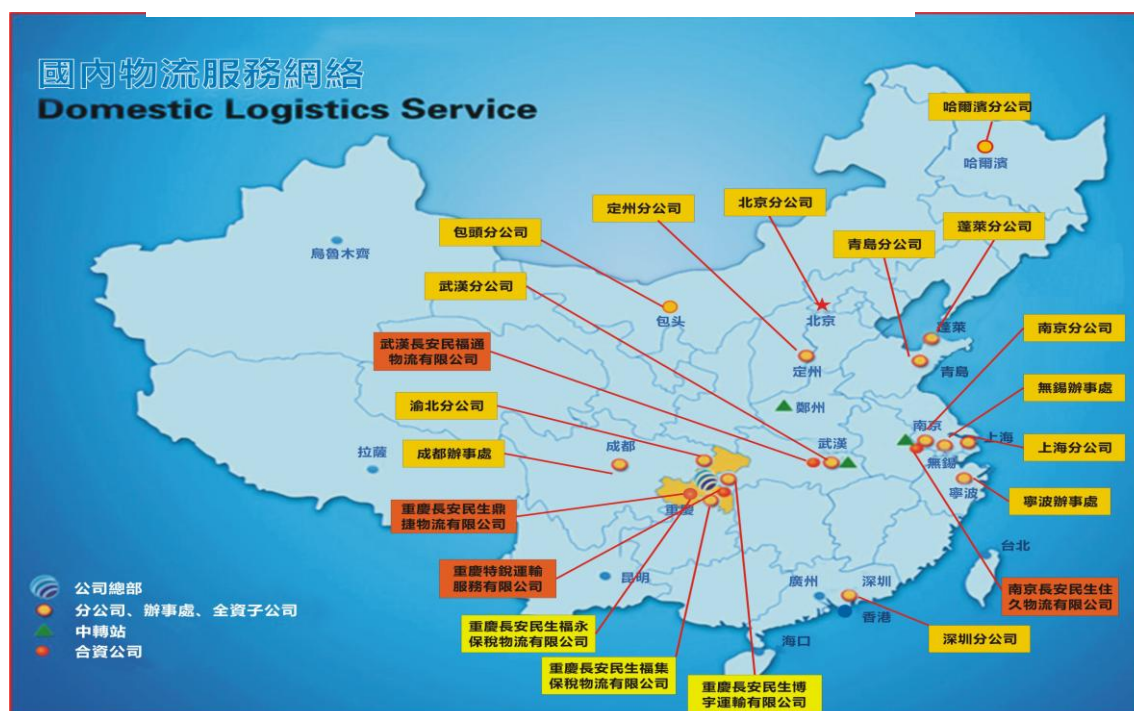
圖二：公司目前的分支機構分佈圖

為完善並擴大服務網路，提高服務能力，本公司強化了分支機構的建設，並通過有效利用資訊技術系統的手段對各分支機構實施科學管理。截至 2011 年 12 月 31 日止，本公司累計建立分公司、子公司、聯營企業和辦事處 21 個，主要分佈在華東、華中、華北、華南和西南地區（圖二）。不斷完善的服務網路，令本集團能提供物流服務至全國各地。