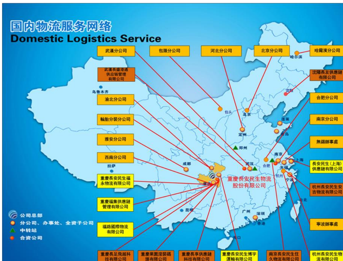
圖二：公司現有分公司、子公司和代表處的地址

於2020年12月31日，本公司累計設立分公司、子公司、聯營企業和辦事處26個，主要分佈在華東、華中、華北、華南和西南地區（圖二）。不斷完善的服務網絡，令本集團能提供物流服務至全國各地。